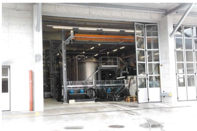
Piazzale di scarico (fig.1)