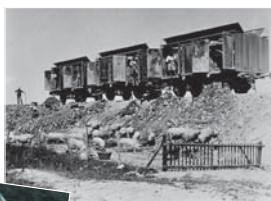
La città di Berna trasporta i rifiuti con il treno a Witzwil. I rifiuti decomposti sono un buon concime per i campi.