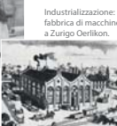
Industrializzazione: fabbrica di macchine a Zurigo Oerlikon.