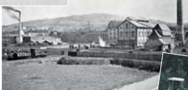
Costruzione del primo impianto di incenerimento nella città di Zurigo, ancora oggi attivo.